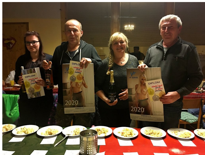
vítězové letošního ročníku v celé své slávě

Hospoda tentokrát praskala ve švech pod náporem všech soutěžících a jejich přátel. Děkujeme manželům Cempírkovým za dodání cen a parádní obsluhu po dobu celé akce.