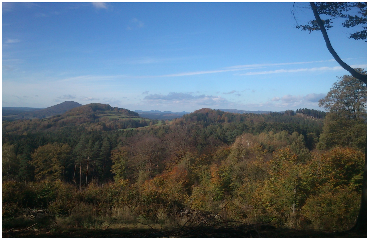
Pod Lipnickým vrchem