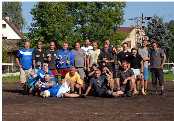
Hromadné foto po odehraném turnaji

Obec Kunratice a Umělecká agentura KAZ Vás zvou na Zábavně hudební pořad pro seniory s tancem