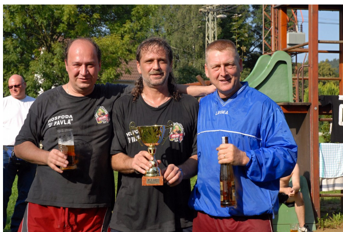
Vítězné mužstvo pod názvem Hospoda u Pavla (Kunratice)